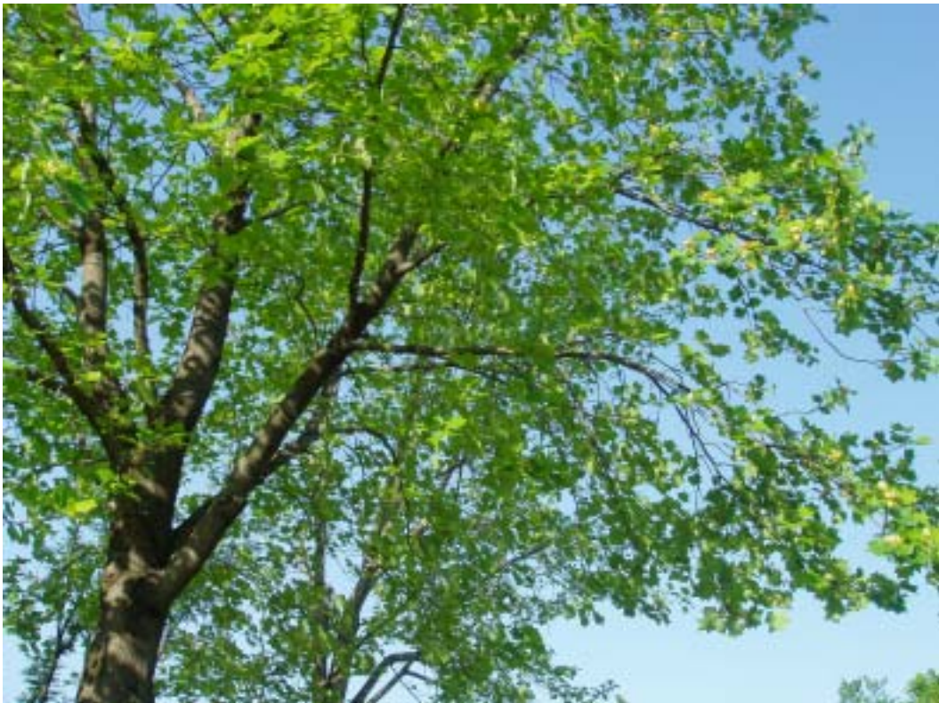
ユリノキ(モクレン科ユリノキ属)